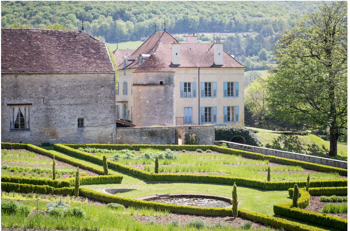
La façade ouest du château de Barbirey, en Bourgogne, le 1er mai.